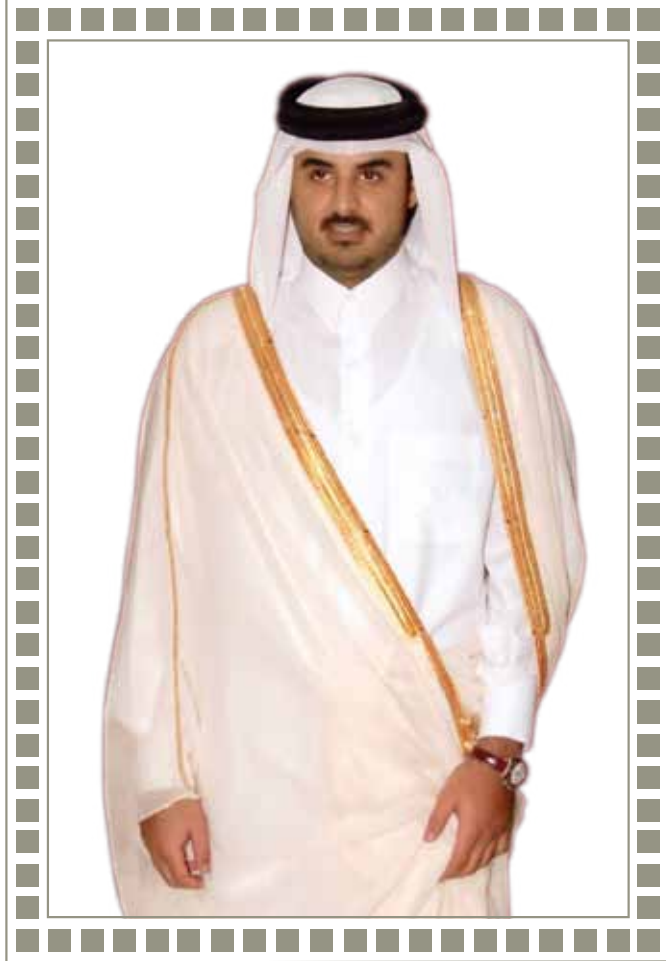
سمو الشيخ تميم بن حمد بن خليفة آل ثاني ولي العهد الأمين