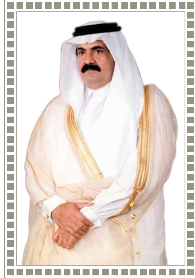
حضرة صاحب السمو الشيخ حمد بن خليفة آل ثاني أمير البلاد المفدى