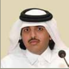
سعادة الشيخ سحيم بن خالد بن حمد آل ثاني عضو مجلس الإدارة