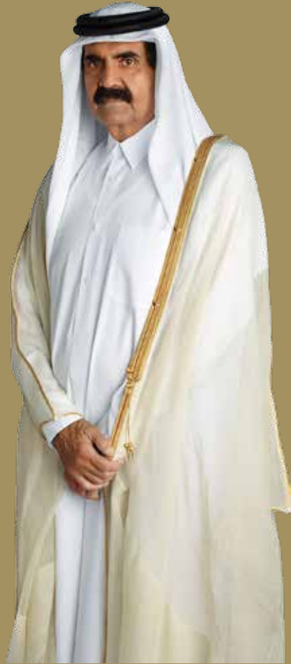
حضرة صاحب السمو الشيخ حمد بن خليفة آل ثاني الأمير الوالد