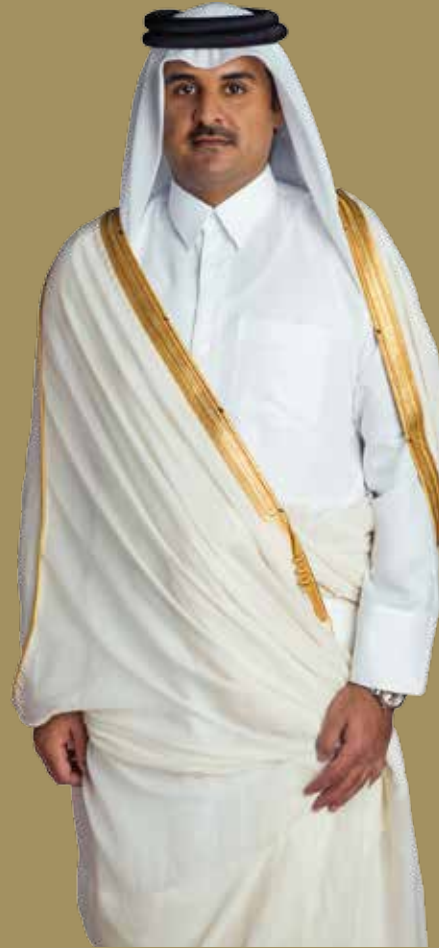
حضرة صاحب السمو الشيخ تميم بن حمد آل ثاني أمير البلاد المفدى