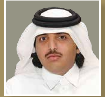
سعادة الشيخ سعيد بن خالد بن حمد آل ثاني عضو مجلس الإدارة